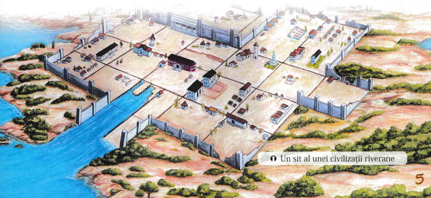
Un sit al unei civilizații riverane

Contribuțiile acestor civilizații timpurii sunt imense. Acestea au deschis calea pentru centralizarea practicilor economice, religioase, culturale, sociale și politice. Rădăcinile structurilor politice moderne și ale sistemelor juridice pot fi, de asemenea, urmărite înapoi în timp până la aceste civilizații antice.